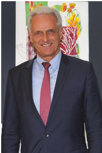
Dr. Peter Ramsauer