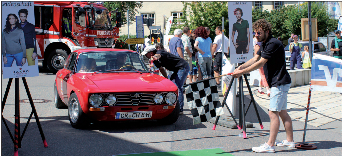
Zieleinlauf am Schrozberger Schloss: Wer gewinnt dieses Jahr die Oldtimer-Rallye?