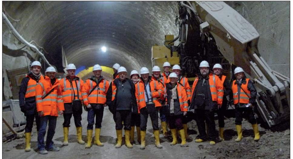
BDS-Führung durch das Straßenbauprojekt B 10-Rosensteintunnel

Dabei konnten sich die Teilnehmer vom zentralen Bauwerk der Großbaustelle – dem B 10-Rosensteintunnel – selbst überzeugen. Mit einer Gesamtlänge von rund 1.300 Meter unterquert der Tunnel den Rosensteinpark und Teile des Zoologisch-Botanischen Gartens Wilhelma. Ziel ist es, im Zusammenspiel mit den verkehrslenkenden Maßnahmen, den Ausweichverkehr in den Wohngebieten der umgebenden Stadtbezirke zu reduzieren. Dabei soll der Verkehr jeweils zweispurig durch die beiden Tunnelröhren auf direktem Wege zwischen den Knotenpunkten Pragsattel und der Verbindung am LEUZE Mineralbad führen. Das gesamte Straßenbauprojekt liegt in einem finanziellen Rahmen von rund