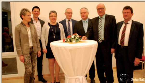
Freude beim Vorstand des GV Burgrieden und seinen Ehrengästen