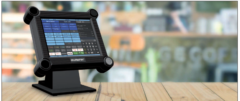
Die elektronische Registrierkasse dient unter anderem zur zeitnahen Aufklärung steuererheblicher Sachverhalte

Zum 31. Dezember 2016 läuft die Übergangsfrist des BMF-Schreibens vom 26. November 2010 (BStBl I S. 1342) zur Aufbewahrung digitaler Unterlagen bei Bargeschäften aus. Ab dem 1. Januar 2017 müssen Unterlagen im Sinne des § 147 Absatz 1 Abgabenordnung, die mittels elektronischer Registrierkassen, Waagen mit Registrierkassenfunktion, Taxametern und Wegstreckenzähler erstellt worden sind, für die Dauer der Aufbewahrungsfrist jederzeit verfügbar, unverzüglich lesbar und maschinell auswertbar aufbewahrt werden (§ 147 Absatz 2 Abgabenordnung).