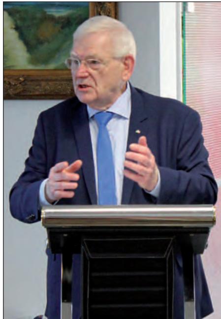
Staatssekretär a.D. Friedhelm Ost

Einig waren sich beide Referenten in der Beurteilung, dass sowohl Union als auch SPD seit Gründung der Bundesrepublik maßgeblich zur Stabilisierung der Demokratie beigetragen hätten und dass es schon deshalb einen gewissen Vorrat an Gemeinsamkeiten gebe. Daher sei es auch nur konsequent, dass sich beide Volksparteien um eine erneute Regierungsbildung bemühen müssten, nachdem die Sondierungsgespräche zu einer Jamaica-Koalition gescheitert seien. Da aber beide Parteien Gefahr liefen, ihren Status als Volksparteien zu verlieren, wie das Ergebnis der letzten Bundestagswahl deutlich gemacht habe, hätten Union und SPD die Pflicht, so Friedhelm Ost, sich wieder verstärkt um ihre Kernwählerschaft zu kümmern. In diesem Zusammenhang kritisierte Ost in einer für ihn ungewöhnlichen Schärfe Bundeskanzlerin Angela Merkel, die nach seiner Auffassung die politischen Koordinaten der CDU immer weiter nach links verschoben habe und inzwischen eine „grüne Kanzlerin“ sei, wie ihre Entscheidungen zur Flüchtlings- und Energiepolitik überdeutlich gezeigt hätten. Dies sei nicht nur bei den CDU-Stammwählern auf Ablehnung gestoßen, sondern habe vor allem die AfD stark gemacht, hob Ost hervor.